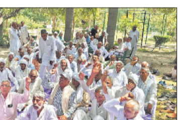
रोहतक। अपनी मांगों के लिए धरना प्रदर्शन करते ऑल रिटायर्ड कर्मचारी वैलफेयर एसोसिएशन के सदस्य।

रोहतक। पंडित नेकी राम शर्मा राजकीय महाविद्यालय के ऑडिटोरियम को आधुनिक सुविधाओं से लैस करने की तैयारी शुरू कर दी गई है। कॉलेज में ऑडिटोरियम को हाईटेक बनाने के लिए नए उपकरण लगाए जाएंगे। इससे विद्यार्थियों और शिक्षकों को बेहतर अनुभव मिलेगा। ऑडिटोरियम के आधुनिकीकरण के लिए करीब 10 लाख रुपये का बजट तय किया गया है। इस राशि से प्रोजेक्टर, साउंड सिस्टम और अन्य आवश्यक तकनीकी उपकरण खरीदे जाएंगे जिससे ऑडिटोरियम को पूरी तरह आधुनिक स्वरूप दिया जा सके। कॉलेज में आयोजित होने वाले सेमिनार, वर्कशॉप और सांस्कृतिक कार्यक्रमों को ध्यान में रखते हुए ऑडिटोरियम में 4के लेजर प्रोजेक्टर और आधुनिक साउंड सिस्टम लगेगा।