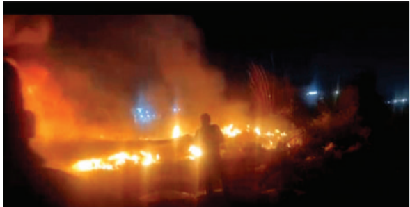
तिलियार के पास उस समय अफरा-तफरी मच गई, जब एक खाली प्लॉट में अचानक भीषण आग भड़क उठी। देखते ही देखते सूखी घास-फूस ने आग को तेजी से फैलाया और आसपास के लोगों में हड़कंप मच गया। आग इतनी तेजी से फैली कि कुछ ही मिनटों में पूरा प्लॉट धुंए और लपटों से घिर गया। प्रत्यक्ष दृश्यों के अनुसार, पास में एक शादी समारोह चल रहा था, जहां खुशी के माहौल में पटाखे जलाए जा रहे थे। इसी दौरान एक चिंगारी उड़कर पास के खाली प्लॉट में जा गिरी, जहां सूखी घास और कचरा पड़ा हुआ था। चिंगारी गिरे

ही आग ने विकराल रूप ले लिया और देखते ही देखते पूरे प्लॉट को अपनी चपेट में ले लिया। स्थानीय लोगों ने तुरंत दमकल विभाग को सूचना दी। सूचना मिलते ही फायर ब्रिगेड की तीन गाड़ियां मौके पर पहुंचीं और आग बुझाने का अभियान शुरू किया। करीब आधे घंटे की मशक्कत के बाद आग पर काबू पाया जा सका। यदि समय रहते दमकल विभाग मौके पर नहीं पहुंचता, तो आग आसपास के रिहायशी इलाके तक भी फैल सकती थी। घटना के दौरान क्षेत्र में धुंए का गुबार छा गया, जिससे लोगों को सांस लेने में भी दिक्कत हुई। कई लोग अपने घरों से बाहर निकल आए और स्थिति पर नजर बनाए रखी। हालांकि, गनीमत रही कि इस घटना में कोई जनहानि नहीं हुई, लेकिन यह हादसा एक बड़ी चेतावनी जरूर दे गया। स्थानीय निवासियों का कहना है कि खाली प्लॉट में लंबे समय से सूखी घास और कचरा जमा था, जिसकी सफाई नहीं कराई गई।