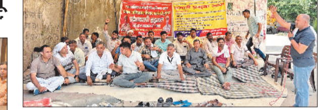
रोहताक। अपनी मांगों के लिए नारेबाजी करते अभिनमशन कर्मचारी।

रोहताक। शहर को स्वच्छ, सुंदर एवं कचरा-मुक्त बनाने के उद्देश्य से निगम द्वारा निरंतर स्वच्छता एवं जन-जागरूकता अभियान चलाए जा रहे हैं। निगम की टीम स्कूल, कालेजों, बाजारों पर विद्यार्थी क्षेत्र में आगमन को स्वच्छता, सिंगल यूज प्लास्टिक न इस्तेमाल करने, गोला व सूखा कूड़ा अलग-अलग करने के लिए प्रेरित कर रही है। टीम द्वारा शहर में स्थानीय नितादंद पब्लिक-स्कूल यथा बाबा मरत नाथ स्कूल में जागरूकता अभियान चलाया गया। टीम द्वारा विद्यार्थियों को गोली एवं सूखे कूड़े का स्रोत पर ही पृथक्करण के महत्व को समझाते हुए बताया गया कि यदि घर से ही कूड़ा को अलग-अलग किया जाए तो उसके विस्तारण एवं पुन उपयोग की प्रक्रिया अधिक प्रभावी बनती है।