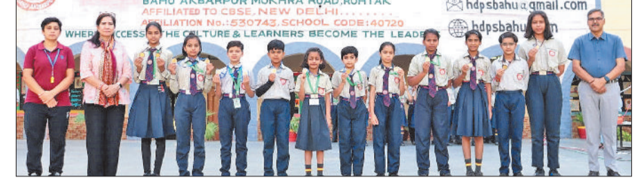
हरिभूमि न्यूज ▶▶ रोहतक

बहु अकबरपुर स्थित एचडी पब्लिक स्कूल के लिए 19 अप्रैल का दिन गर्व और उल्लास से भरा रहा, जब विद्यालय के प्रतिभाशाली विद्यार्थियों ने नवयुग शिक्षा निकेतन सीनियर सेकेंडरी स्कूल में आयोजित इंटर स्कूल योगा प्रतियोगिता में शानदार प्रदर्शन करते हुए अपनी प्रतिभा का लोहा मनवाया। इस प्रतियोगिता में लगभग 40-50 विद्यालयों के बीच कड़ी प्रतियोगिता देखने को मिली, लेकिन एचडी पब्लिक स्कूल बहुत अकबरपुर के विद्यार्थियों ने आत्मविश्वास, अनुशासन और योग के प्रति समर्पण के बल पर 20 से अधिक पदक जीतकर सबका ध्यान अपनी ओर आकर्षित किया। प्रतियोगिता में विद्यार्थियों ने अपने संतुलन, लचीलापन और एकाग्रता का बेहतरीन प्रदर्शन किया। हर प्रस्तुति में उनके आत्मविश्वास और अभ्यास की झलक साफ दिखाई दी। कठिन आसनों को सहजता से करते हुए उन्होंने निर्णायकों को प्रभावित