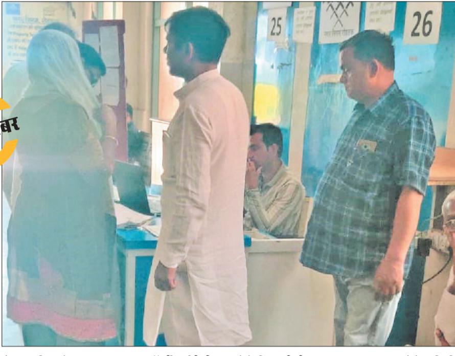
रोहतक। निगम में बनाए गए काउंटर पर प्रॉपर्टी आईडी ठीक कराने के लिए लगी भीड़।

हरिभूमि न्यूज ▶▶ रोहतक शहर में प्रॉपर्टी आईडी से जुड़ी समस्याएं थमने का नाम नहीं ले रही हैं। नगर निगम के आंकड़ों के अनुसार शहर में करीब दो लाख प्रॉपर्टी आईडी बनाई गई हैं, लेकिन इनमें से सवा लाख से ज्यादा आईडी अब तक वेरिफाई ही नहीं हो पाई हैं। ऐसे में हजारों लोग रोजाना अपनी प्रॉपर्टी आईडी ठीक करवाने के लिए नगर निगम के चक्कर काटने को मजबूर हैं।