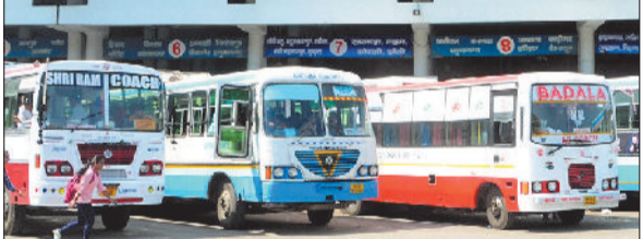
कॉलेजों और स्कूलों में पढ़ने वाले 15 हजार से अधिक विद्यार्थियों को सीधा लाभ मिलेगा, जो रोजाना अपने गांवों और आसपास के क्षेत्रों से बसों में सफर करते हैं। अब उन्हें बसों में यात्रा के दौरान किसी प्रकार की परेशानी का सामना नहीं करना पड़ेगा और उनका आवागमन अधिक सुगम व सुरक्षित होगा। पत्र में बताया गया है कि विभाग को लगातार शिकायतें मिल रही थीं कि राज्य के निजी स्टेज कैरिज संचालक स्कीम 2016 के तहत निर्धारित शर्तों का पालन नहीं कर रहे हैं। विशेष रूप से, वे छात्रों और अन्य रियायती या मुफ्त पास धारकों को बसों में बैठाने से मना कर देते हैं, जो नियमों का स्पष्ट उल्लंघन है। आदेश में स्पष्ट किया गया है कि परमिट धारक बस संचालकों को छात्रों और रियायती या मुफ्त पास धारकों को उसी प्रकार बसों में यात्रा की सुविधा देनी होगी, जैसे हरियाणा रोडवेज द्वारा दी जाती है।

नियम लागू करने के सख्त निर्देश, उल्लंघन पर होगी कड़ी कार्रवाई हरिभूमि न्यूज ▶▶ रोहतक